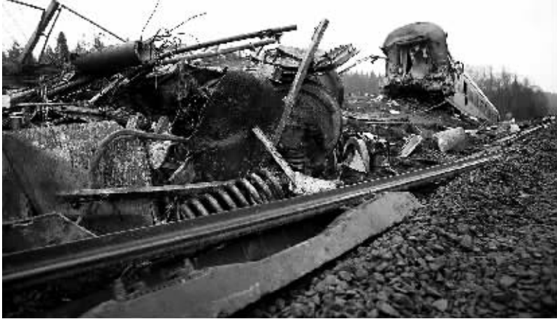
在俄罗斯特维尔州博洛戈耶市拍摄的俄客列车脱轨事故现场。