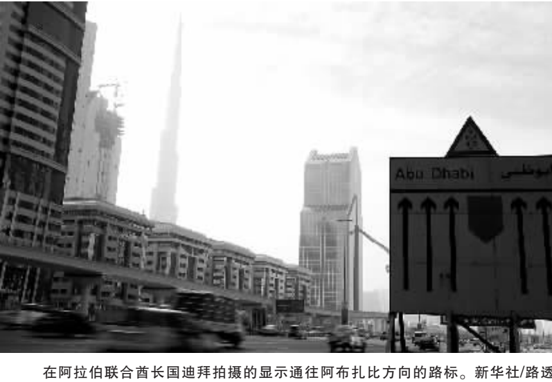
在阿拉伯联合酋长国迪拜拍摄的显示通往阿布扎比方向的路标。