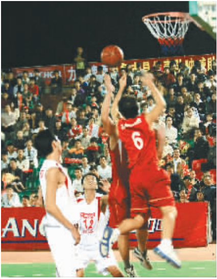
省篮球联赛争夺激烈。

本报讯（记者林永成 通讯员高芳松）2009年“力加杯”省篮球联赛A组比赛，6日晚在乐东战罢小组单循环赛，东道主乐东队三战全胜利列小组第一。 A组比赛有乐东、东方、昌江和澄迈四支队参加。乐东队在该组中实力出众，该队老队员经验丰富，年轻队员冲劲十足，他们内外结合，三场小组赛均轻松战胜对手，其中85:57胜昌江、77:59胜东方、80:64胜澄迈。澄迈队以2胜一负的战绩居小组第二，昌江队一胜两负列第三，东方队三战皆负垫底。 B组比赛将于本周末在琼中进行，参赛四支队为琼海、琼中、海大和海师队。本次比赛由省文体厅主办，省体育总会承办，海南亚洲太平洋酿酒有限公司协办。