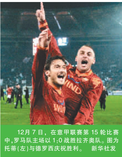
12月7日，在意甲联赛第15轮比赛中，罗马队主场以1:0战胜拉齐奥队。图为托蒂（左）与德罗西庆祝胜利。 新华社发

新华社华盛顿12月6日电（记者梁金雄）一天前在与火箭队交手时受伤的2007年NBA状元秀、开拓者队的奥登6日接受了膝部手术。术后开拓者队证实，奥登本赛季已没有机会再亮相赛场。 奥登在当日发表的一份声明中说：“这对我来说是一次挫折，但我会回来的，现在我掌握在上帝的手中。” 奥登的NBA之路始终与伤病紧密联系。2007年他在选秀大会上以“状元”身份被开拓者队选中后，就因膝盖软骨受损错过了该赛季的全部比赛。上个赛季他终于得以参赛，可首场与湖人队的比赛就右脚受伤，错过了6场比赛；赛季中期他又因左膝受伤，连续14场无法为球队效力。本赛季奥登的状态明显提高，个人各项比赛数据均比上赛季有所提升，场上的自信心也越来越强。可左膝盖骨再度断裂，让他的职业生涯再次蒙上了一层阴影。