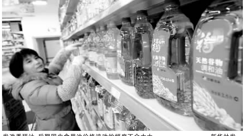
发改委预计,后期国内食用油价格波动的幅度不会太大。

综合这些因素,我们认为今后一段时间居民消费价格总水平将继续保持基本稳定的态势,出现明显通货膨胀的可能性不大。(据新华社北京12月14日电)