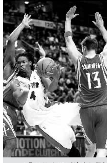
12月14日,在NBA常规赛,猛龙队以101:88胜火箭队。图为猛龙队球员波什(中)在比赛中带球突破。

今年7月,NBA湖人队球星阿泰斯特访问海南。这是NBA球星首次来到海南。此前,NBA球星曾推广和宣传,首选京津沪穗等国内特大城市,海南难入他们的法眼。(本报海口12月14日讯)