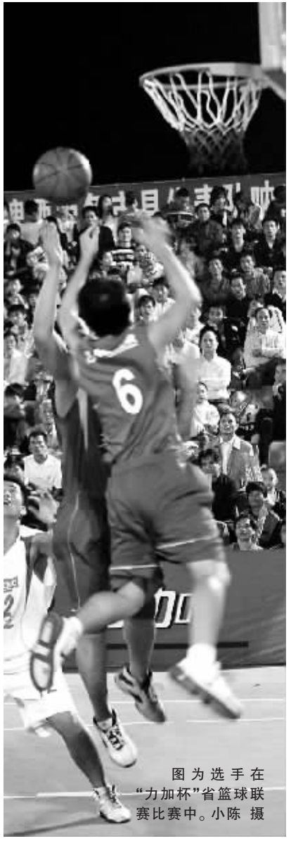
图为选手在“力加杯”省篮球联赛中比赛中。

“力加杯”省篮球联赛正在我省西部市县如火如荼地举行。在人们的印象中,海南人在排球和足球项目上颇有建树,好几位选手曾入选过国家队和国家青年队,而三大球中的篮球运动则是海南人的“弱项”。其实,事实并非如此。