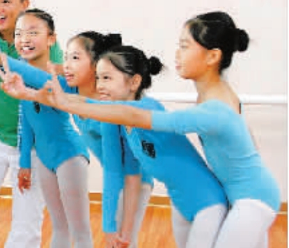
齐英石人物画精品展现场