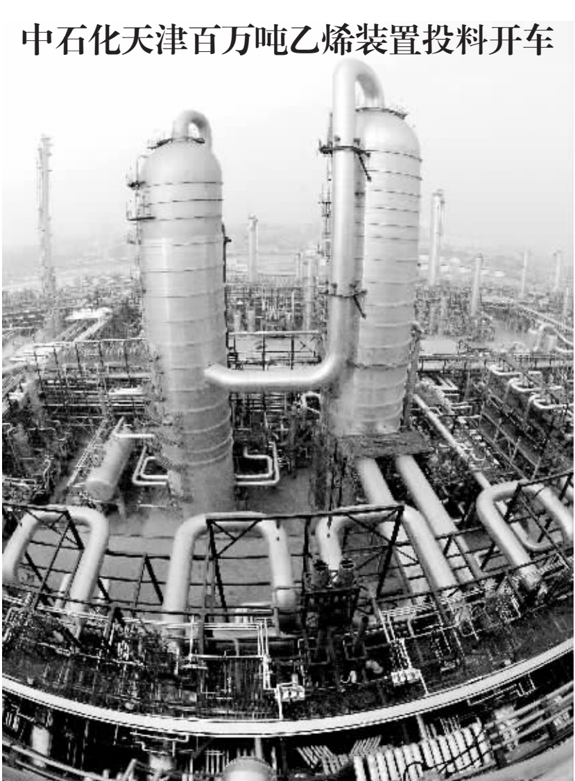
这是中国石化天津100万吨/年乙烯装置外景(1月16日摄)。 当日,中国石化天津100万吨/年乙烯装置投料开车。该项目是国家和中国石化“十一五”重点建设工程,也是天津滨海新区开发开放的标志性工程和天津建设国家级石化产业基地的龙头项目。据介绍,该项目总占地面积297公顷,主体建设投资268亿元,加上配套工程,达到340亿元。初步测算,项目建成后,可拉动天津工业总产值4%以上,并带动下游产业及配套工程投资约1000亿元。

“孩奴”现象困扰“80后” 专家呼吁抚育孩子要理性 社会观察 记者今天连续走访了广东梅城几家超市和婴幼儿专卖店了解到,现在“80后”的家长越来越舍得给孩子花钱,也催生了一批幼儿用品商店。消息人士透露,越是进口昂贵的商品,卖得越好。而有些夫妇为了让孩子吃好、穿好,专程前往港澳甚至海外分批抢购原装进口商品,有的家长痛下血本一年为孩子花销钱高达三四万元人民币,最少的也要一万元人民币左右。这对于人均月收入仅一千元人民币左右的梅城市民来说,确实是一个负担。 据某网去年十二月的调查显示,超过八成以上的年轻家长们感到抚养孩子的经济压力太大。而养育费用水涨船高是不愿生育的首要因素,还有网友留帖形容,“生孩子就给套牢,股票可以解套,这只股永远也解不了。” 眼下,中国已婚人群中不孕不育的比 例持续呈上升趋势。据统计,二十年前,中国育龄人群中的不孕不育比例只占到不到百分之五,但当前竟然增长了三倍,其中大都市的现状更为严峻。 有心理专家指出,现代社会中生活环境变化,社会节奏加快,工作竞争加剧,增大了人们的生理和心理压力,许多“80后”因此而推迟婚育年龄,并错过了最佳生育时期。同时“丁克”家庭越来越多地涌现出来。 家住广州的小洁从澳洲一大大学毕业回国后在一外资企业上班。新年伊始,她与在南方航空公司的男友完婚。然而小洁最近患上了“孩奴”恐惧症。一听到孩子嬉戏的声音,她就头晕。她觉得生了孩子会丢掉工作,会引起离婚,担心孩子将来啃老。 “孩奴”,到底还是不当?是困扰现在“80后”夫妇的一大问题。不过,也有不少夫 妇并不惧怕做“孩奴”。 来自茂名的小唐嫁到梅州后,如今和老公一起在梅州创业奋斗了两年。去年她刚添了一个儿子。她认为,“孩奴恐惧症”在梅州不算严重。“有许多朋友陆续走向婚姻,第一心愿就是希望有孩子。”小唐觉得,有些年轻人可能会有当“丁克”一族的念头,但在客家山区,传宗接代的观念依然浓厚,家族的压力会让他们放弃这样的想法。 面对“孩奴恐惧症”侵袭“80后”,有心理专家指出家长应理性。多注重和孩子沟通交流,把精力和经济更多放在培养孩子的观察、表达和生活自理能力,以及激发自信心、求知欲和学习兴趣上。 有专家呼吁,优化孩子抚育成本的结构,提升单位成本的效用,或许是一个以较少的成本获得更多回报的理性选择。 (来源:中国新闻网)