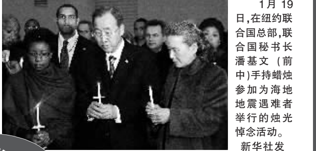
1月19日,在纽约联合国总部,联合国秘书长潘基文(前中)手持蜡烛参加为海地地震遇难者举行的烛光悼念活动。