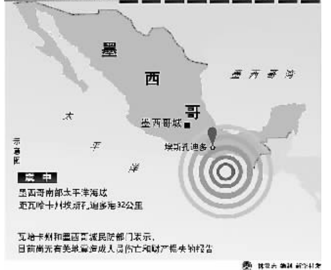
墨西哥南部太平洋海域,近瓦哈卡州海岸,距多海32公里。瓦哈卡州和墨西哥民防部门表示,目前尚无有关地震造成人员伤亡和财产损失报告。