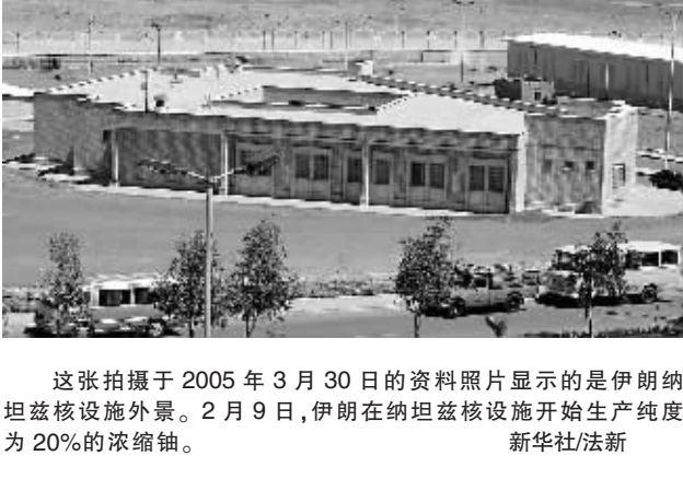
这张拍摄于2005年3月30日的资料照片显示的是伊朗纳坦兹核设施外景。2月9日,伊朗在纳坦兹核设施开始生产纯度为20%的浓缩铀。