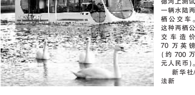
在英国苏格兰格拉斯哥,斯特奇奇公司9日在克莱德河上测试一辆水陆两栖汽车。这种两栖公交车造价70万英镑(约700万元人民币)。