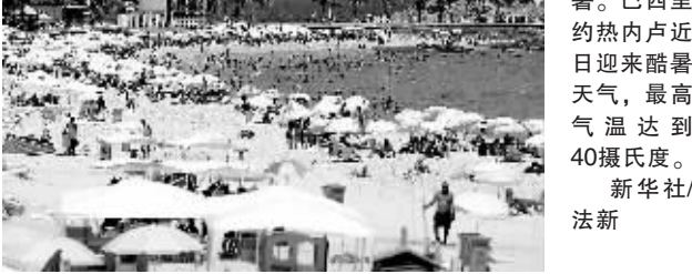
2月8日,人们在巴西里约热内卢的伊帕内马海滩避暑。巴西里约热内卢近日迎来酷暑天气,最高气温达到40摄氏度。