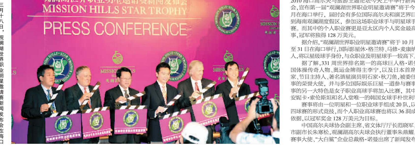
三月十八日,观澜湖世界职业明星邀请赛新闻发布会在海口观澜湖度假区举行。