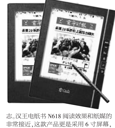
志,汉王电纸书N618阅读效果和纸媒的非常接近,这款产品更是采用6寸屏幕,

汉王N618除了预装2000多册畅销图书之外,还可随时登陆汉王书城,阅读和下载最新新闻资讯,汉王书城涵盖了《京华时报》、《环球时报》等各类报刊杂志。