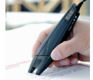
用速录笔收集资料,看到哪里,就扫到哪里,电脑录入同步完成,效率空前提高,是文字工作者必不可少的好帮手!

轻巧易用 工作学习好帮手 汉王速录笔轻巧易用好上手。对于搞研究、作报告、写文章、著书立说等经常与文字打交道的人士可谓雪中送炭,