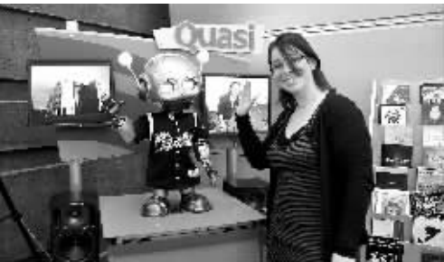
卡耐基—梅隆大学的娱乐科技中心 3月22日,在美国匹兹堡的卡耐基—梅隆大学娱乐科技中心,一名访客与该中心研发的小型机器人合影。

比尔·盖茨要开发新型核反应堆 新华社3月23日电 美国微软公司创始人比尔·盖茨控股的TerraPower计划与日本企业东芝合作,开发新型核反应堆。 路透社报道,这种新型核反应堆100年内无需添加燃料。现阶段核电站多数采用轻水反应堆,每隔几年就要添加燃料。 东芝23日说,这一项目谈判处于起始阶段,没有作出任何实质决定。东芝发言人大森惠介(音译)说:“东芝与TerraPower已开始初步洽谈,我们正在探讨是否能合作。” TerraPower总部设在华盛顿州,致力于开发生产清洁能源的新途径,改进核电生产方式。 日本《经济新闻》报道,新型核反应堆名为行波反应堆(TWR),以贫铀为燃料。盖茨预计会动用个人财产支持TWR开发,投资额可能为数十亿美元。 2006年收购著名核能企业美国西屋公司后,核反应堆建造成为东芝一大核心业务。 东芝已设计出一种号称超级安全、超小型、超简单的4S核反应堆,能连续运行30年。东芝希望美国政府批准它2014年以前开始建设4S反应堆,预计这种反应堆技术的80%可用于TWR。 开发TWR的一个难题是开发能经得住长时间核反应的材料。解决这个问题预计耗时超过10年。