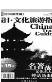
汕头大学出版社编 辑、出版

《中国深度游:假日·文化旅游指南》讲述了深度游不同于一般旅游之处,在于它更强调旅游的内涵,以关怀挚爱的情感审视和欣赏自然美景,突出艺术风格和另类体验,从而带给旅游者全新而有特色的知性满足。通过阅读《中国深度游:假日·文化旅游指南》,你的身心将得到空前的释放,就算不用博览群书,尽搜网站,亦能身临其境地感受这些文化旅游景观,了解它们背后的传奇历史与经典故事,给自己带来强烈的精神震撼和深刻的人生感悟。探寻华夏文明脚步体验造物奇景,一个你不可错过的跨时空传奇之旅。