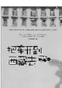
作者:扎西顿珠 台海出版社

西藏,在很多人的眼里是个神秘的地方,它以其特有的魅力吸引着全球游人的目光。作者扎西顿珠以一个旅游车司机的身份,或曰半职业化司机的身份(因为有时作者本人也是个游人),向人们讲述了他与形形色色的客人之间所发生的种种有趣的故事。