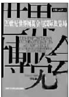
作者:(法)Marcel Galopin 上海科学技术文献出版社

本书系上海图书馆“世博信息丛书”系列之一,重点介绍20世纪世界博览会的发展进程。不同之处在于作者跳跃式地回顾了20世纪30年代以前的世博会历史,把眼光更多地瞄向30年代国际合作普遍开始之后的博览会特点,针对博览会主办方、组织者、参展方以及参观者等各方的价值意义分不同主题加以阐述。本书的另一特点是将世博会的演变与国际展览局的影响》、《国际博览会影响研究》等专题丛书后的又一力作,力求突破狭义的博览会概念而从更广阔的视角来介绍与剖析世博会。