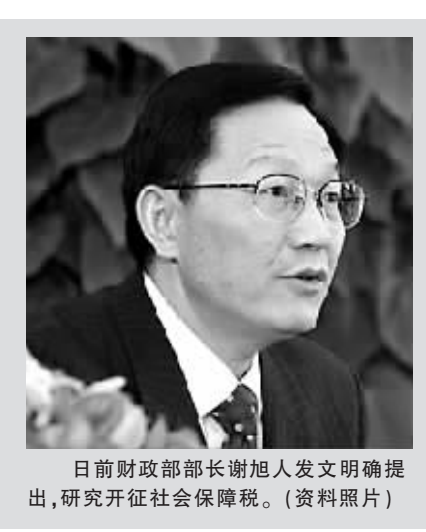
日前财政部部长谢旭人发文明确提出，研究开征社会保障税。（资料照片）

2010年1月，国务院发布了《关于完善城镇企业职工基本养老保险制度的决定》，其中明确提出，要逐步提高我国直接税的比重，更好地发挥税收调节收入分配的作用。