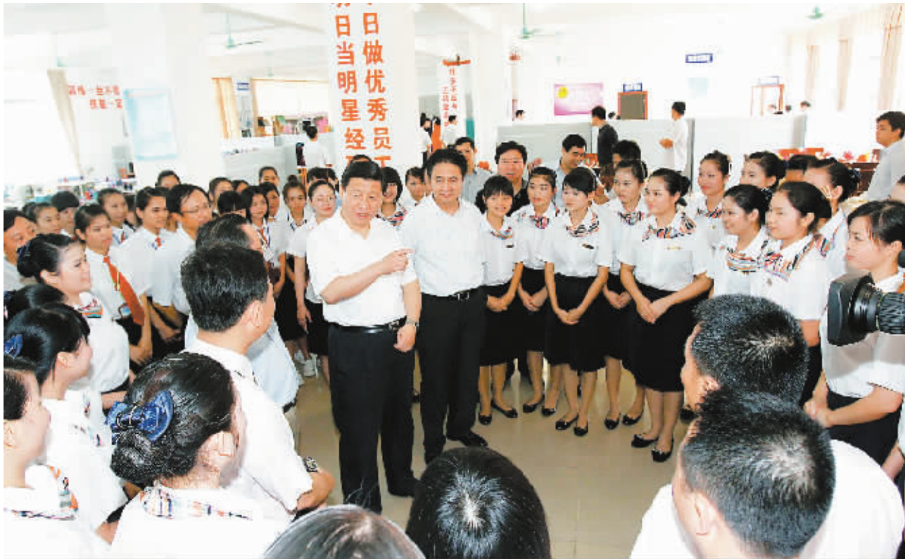
4月13日,习近平在海南经济技术学校考察,勉励同学们发奋学习、提高素质、锻炼身体,努力成为国家建设的有用之材,回报祖国、回报社会、回报父母。