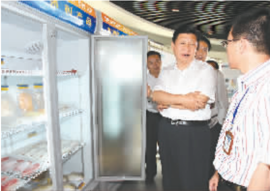
4月13日,习近平在通威(海南)水产食品有限公司听取生产经营和自主创新情况的介绍。