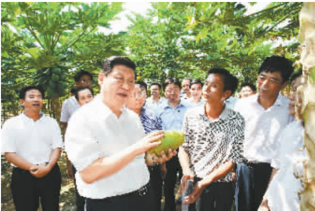
4月12日,习近平在乐东县卧龙岭现代农业生产基地了解大力推广先进生产技术、形成规模化和产业化发展的情况。