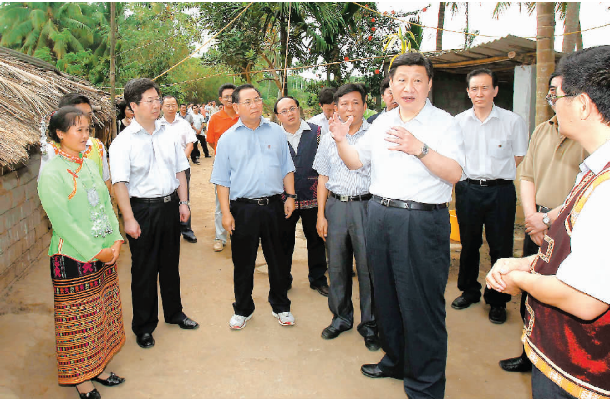
4月11日,习近平在保亭县三道镇什进村了解扶贫开发特别是困难群众的生产生活情况。