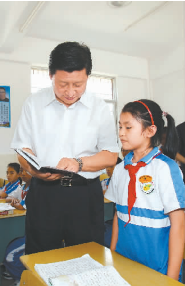
4月12日,习近平在考察海南教育扶贫移民项目昌江县思源实验学校时,在课堂上了解同学们的学习情况。