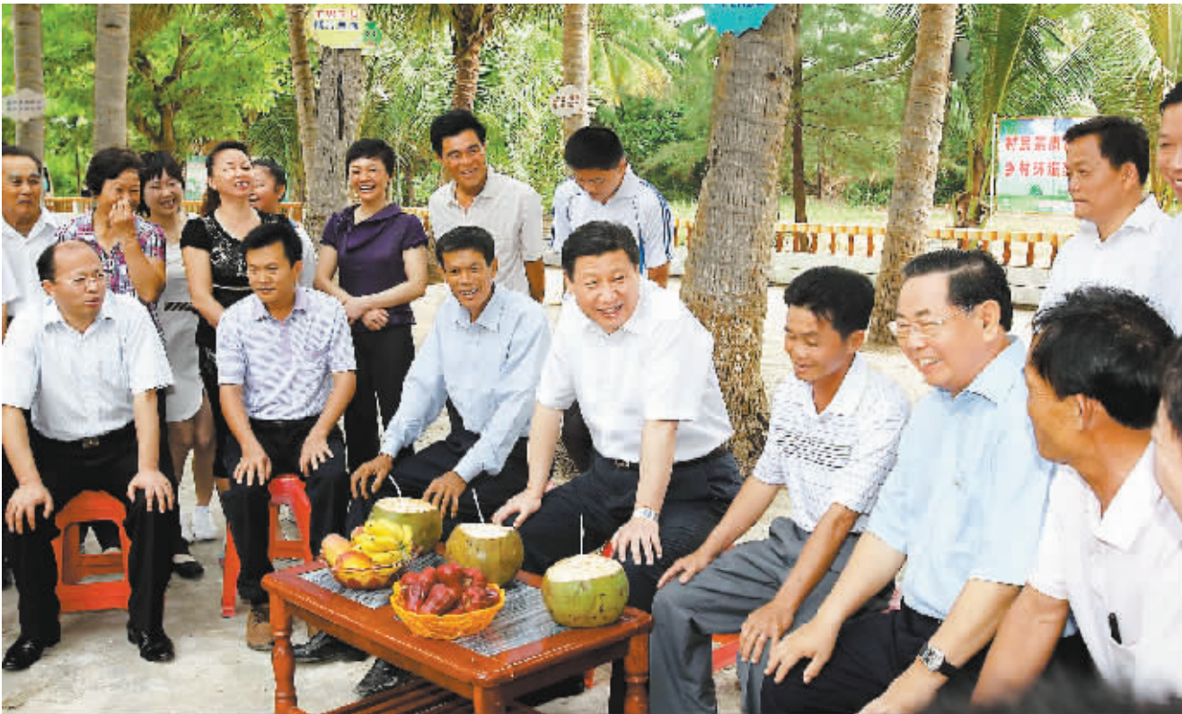
4月11日,习近平在万宁市龙滚镇福塘村与村民和基层党员代表座谈,听取基层党组织建设和深入学习实践科学发展观活动等情况介绍。