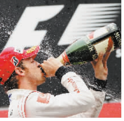
巴顿在领奖台上庆祝胜利。