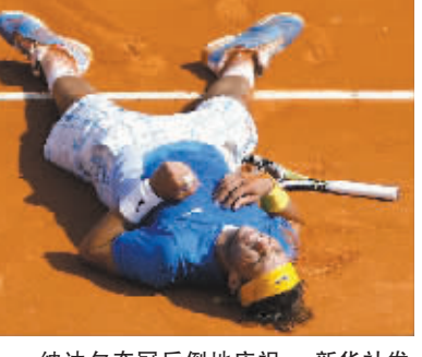
纳达尔夺冠后倒地庆祝。

本报讯 北京时间4月18日晚,总奖金为275万美元的ATP大师1000赛蒙特卡洛大师赛收拍。“红土之王”西班牙选手纳达尔以6:0、6:1血洗同胞沃达斯科,夺得冠军。获胜后的纳达尔将在摩纳哥乡村俱乐部的连胜纪录提高到了惊人的32场,从而第六度在这片红土场上封王,成为公开赛时代以来第一个在一项赛事创造六连霸伟业的男子选手。纳达尔夺冠也结束了自己长达11个月的冠军荒。这也是纳达尔的第16座大师赛冠军奖杯,他追平了费德勒的大师杯冠军数,距阿加西17冠的纪录仅一步之遥。(约翰)