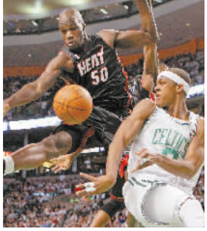
4月18日,在NBA季后赛中,凯尔特人队主场以85比76战胜热火队。图为凯尔特人队球员隆多(右)在热火队球员安东尼的防守下传球。

东部联盟 骑士 96:83 公牛(骑士1:0领先) 老鹰 102:92 雄鹿(老鹰1:0领先) 凯尔特人 85:76 热火(凯尔特人1:0领先) 西部联盟 掘金 126:113 爵士(掘金队1:0领先)