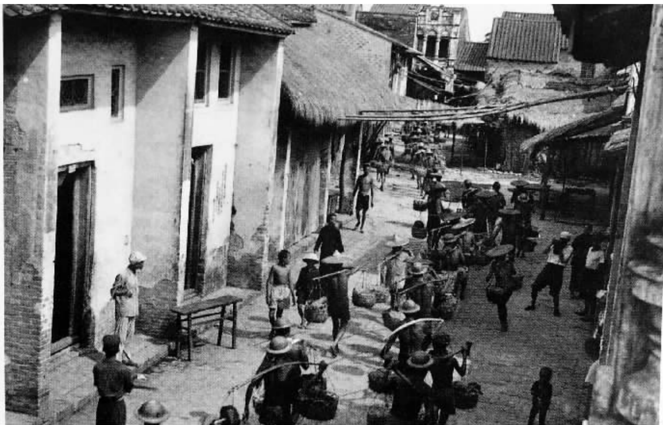
群众从几十里以外的五指山担着当地的土特产来慰问子弟兵。

黑夜虽然漫长,但黎明终要到来。中国人民解放军渡海作战,让琼崖人民等来了黎明的曙光。黎明的召唤,令他们热血沸腾,奋勇无畏。琼崖党政军民为迎接、配合野战军渡海作战,竭尽全力作了充分的准备,为海南的解放作出了重大的贡献。