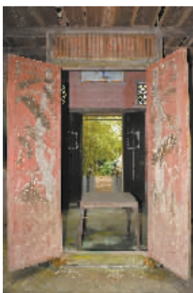
卢宅雕花大门，展示出主人家往日的富贵。