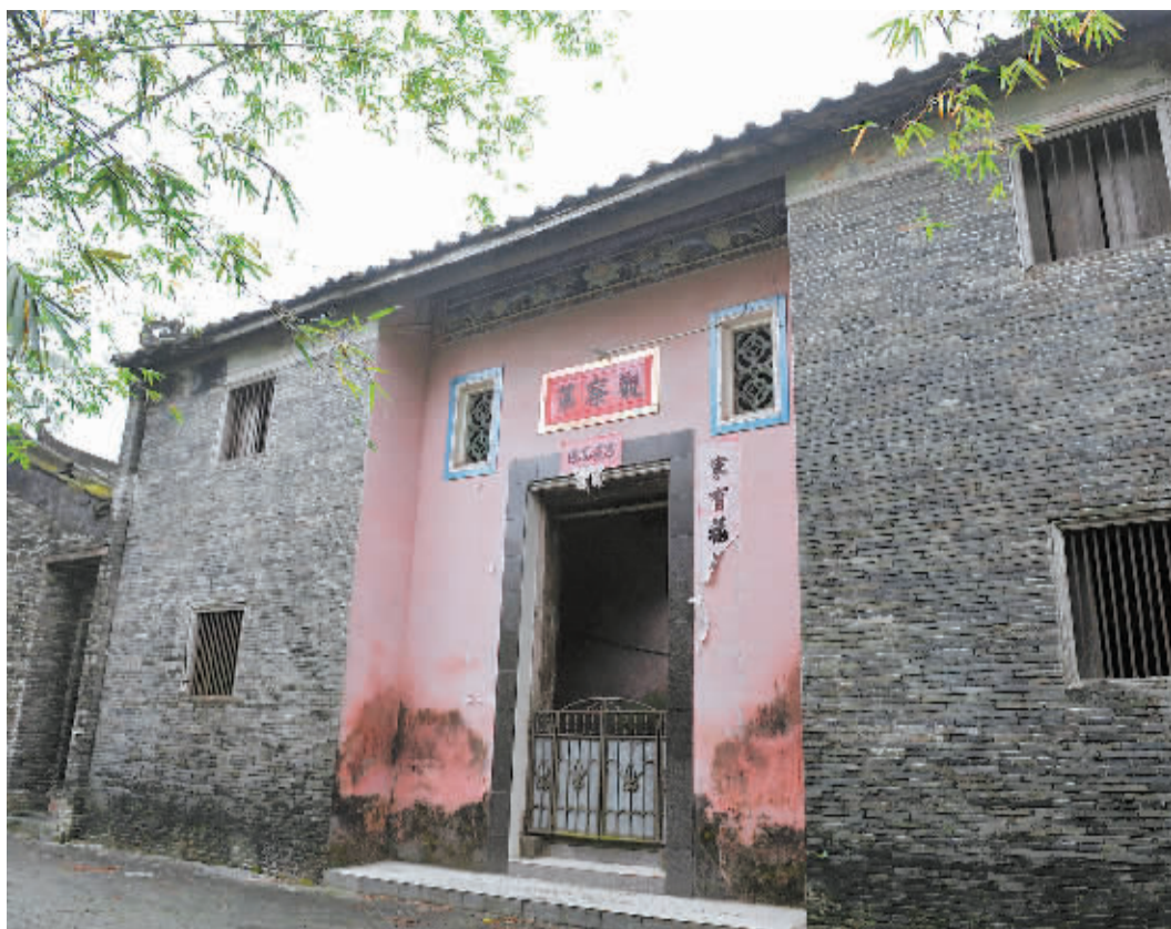
琼海嘉积镇逢龙村的卢家百年老宅

初 春的阳光正好，琼海嘉积镇逢龙村的卢家百年老宅，在阳光的照耀下显得沧桑而安详。村里大部分人都下地干活去了，村子特别安静，微风吹动竹叶的沙沙声就像一首摇篮曲。放眼望去，青灰色墙体的卢宅比村子里任何一间民居都要高大。