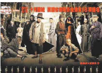
《十月围城》既是商业大片，也是一部优秀的以“国家叙事”为基点的跨越之作。

据新华社昆明4月19日电(记者陈鹏)第29届香港电影金像奖大幕落下,《十月围城》毫无悬念地获最佳影片。从本届入围名单来看,香港电影俨然通过与内地的全方位合作走出了低谷,重现精彩。