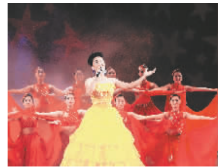
4月19日晚,纪念海南解放60周年暨欢庆五一大型文艺晚会在海口人大大会堂举行。图为晚会现场的歌舞表演。

省民族歌舞团负责人告诉记者,为了这次晚会,全体演职人员精心创作排练,其中绝大部分节目都是为本次晚会专门创作的。整场演出从舞美、服装到灯光设计等,都强调营造一种喜庆欢乐的气氛。尤其值得一提的是,本次晚会采取市场化运作方式,所有的门票都由演出经纪公司负责销售。该负责人表示,省民族歌舞团今后将继续坚持商业运营的模式,力争取得社会效益和经济效益的双丰收。