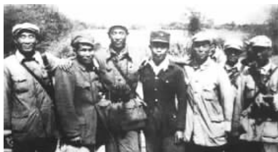
1950年3月6日琼崖纵队一总队队长陈光率部队成功接应先锋营登陆并胜利会师后合影。