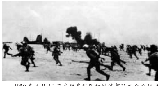
1950年4月16日在琼崖纵队和潜渡部队的全力接应下，第四野战军第40军、第43军主力强渡琼州海峡，彻底打垮了号称“固若金汤”的国民党海陆空“伯陵防线”，解放了海南岛。图为主力部队冒着敌军炮火强行登陆海南一瞥。