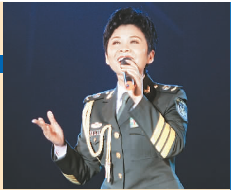
王宏伟(左图)董文华(上图)在晚会上演唱

现场观众演唱了《草原夜色美》。随后,著名相声演员李金斗、侯冠男带来了相声表演,他们的演出引发了现场阵阵轰动,晚会气氛活跃起来,孩子们的脸上也挂满了笑容。