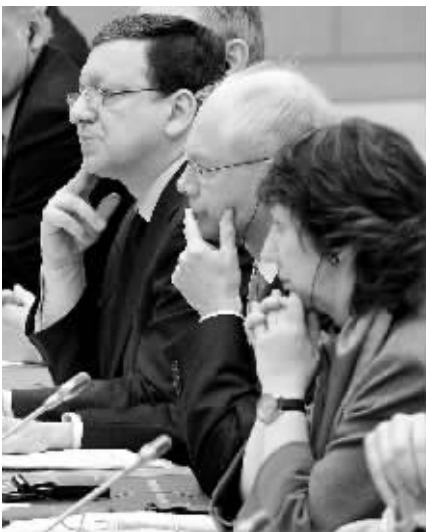
4月28日,在日本东京的首相官邸,欧盟委员会主席巴罗佐(右三)、欧洲理事会主席范龙佩(右二)等出席日本-欧盟定期首脑峰会。双方同意进一步加强伙伴关系,并在解决伊朗核问题方面加强合作。