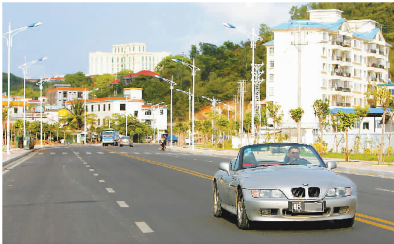
经过几个月的整治,三亚的城市卫生和旅游环境得到了极大改观。图为5月3日,在三亚市城乡结合部的南边海路上,一来自广东的自驾游游客正在平坦干净的马路上轻松自驾。

除了道路、厕所等设施的完善,三亚还在市区多条道路增设了交通标识牌和交通安全护栏,在道路沿线增加大容量的垃圾箱。同时,还开通了市区通向“国家海岸”海