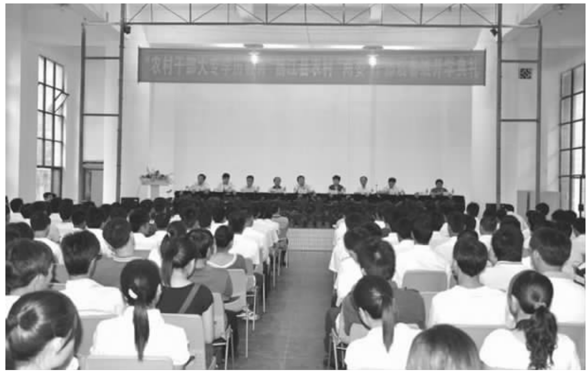
昌江农村两委干部班开学典礼

海南广播电视大学创建于1983年9月,当时是广东省的地、市级电大分校。1989年3月学校升格为省级电大,是我省唯一一所开展现代远程教育的省属高等学校。当前学校有两个校区:龙华校区与海甸校区(原海南教育学院)。 经过二十多年的办学历程,海南广播电视大学已在全省范围内建立了19个市县电大分校、办学点,形成了以中央电大为龙头、省级电大为中心,覆盖全省城乡的现代远程教育网络。2000年秋,经教育部批准,学校开始启动“中央广播电视大学人才培养模式改革与开放教育试点”项目;2003年4月,学校顺利通过开放教育试点中期评估;2007年10月,学校顺利通过开放教育试点总结性评估,被教育部专家组评估为“合格学校”。 近年来,学校始终站在现代教育技术革新大潮的浪尖,致力于现代远程教育技术环境的建设,现已建成技术先进、比较完善的现代远程教育技术平台,在传输手段上实现了从卫星电视单向传输向基于计算机网络和卫星电视网络有机结合的数字化、多媒体、双向交互传输的转变,并建有一批支持远程教学的计算机教室、多媒体教室、视听阅览室、电子阅览室等,形成了基于卫星电视网、计算