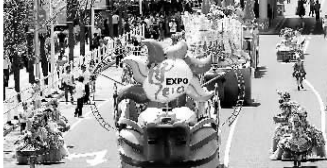
↑5月3日,演员们在“欢乐盛装大巡游”上表演。当日,以“带着世界的笑容、歌唱城市的未来”为主题的2010年上海世博会“欢乐盛装大巡游”在世博园举行。