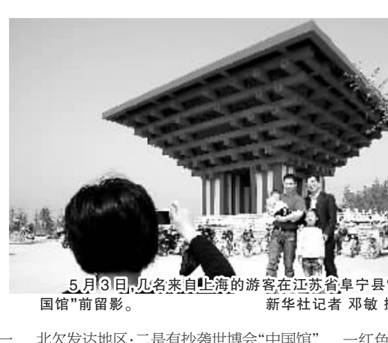
5月3日,见来自上海的游客在江苏阜宁县“山寨版中国馆”前留影。

上海世博会开园三日,江苏省阜宁县耗资数百万元兴建“山寨版中国馆”的消息引发广泛关注和质疑。经济欠发达的阜宁县为何要建“山寨版中国馆”?当地群众和有关人士如何看待这一现象?记者就此进行了跟踪采访。这个被网友称为“山寨版中国馆”的雕塑,位于阜宁县城南的204国道和329省道交汇处,远远看去,是一座上部为四方冠形结构的红色建筑,外形酷似上海世博中国馆。走近一看,这一建筑约六七层楼高,顶端是标志性的四方形平台,中间为6层架空结构,下面还有四根大立柱,整体造型虽然粗糙,但在结构、色调和外形等方面与上海世博中国馆颇为相似。