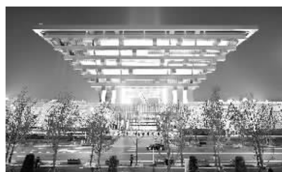
建筑——这是上海世博园标志性建筑。

大红外表,斗拱巍峨的“东方之冠”——中国国家馆究竟蕴藏着什么?是价值连城的古代瑰宝?还是面向未来的前沿科技?中国国家馆5月3日共接待4.56万人次,为3天来最多。不仅是全国各地游客的心之所向,也是吸引外国媒体和专家学者关注的焦点之一。上千个“古人”在一幅巨型《清明上河图》中悠闲地过着属于自己的生活……凡到过中国馆的观众,大多会被这幅放大了数百倍,用现代多媒体技术“激活”的张择端《清明上河图》所深深震撼。排队进入“斗拱”造型的中国馆,在9米平台搭乘指定的电梯抵达标高49米的第一展区“东方足迹”。乘电梯如同乘“动车组”列车,“车门”打开,一场中国特色的“城市之旅”就此展开。步出电梯,走过由全国各地城市名称组成的“斑马线”,进入一个可以容纳700人的多银幕影院,中国馆主题电影短片《和谐中国》和《历程》在此交替播放。