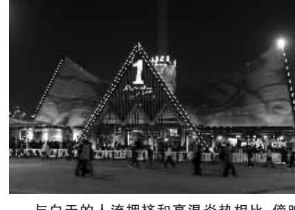
与白天的人流拥挤和高温炎热相比,傍晚的世博园显得平静而舒适。而此时各个场馆在五颜六色灯光的照射下,更是美不胜收,光彩夺目。在下午5点后进场夜游世博,在轻松中感受精彩。图为夜色中的马来西亚馆。