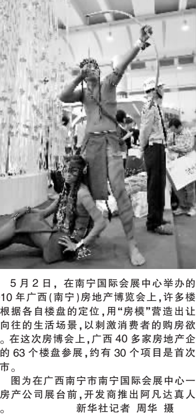
5月2日,在南宁国际会展中心举办的2010年广西(南宁)房地产博览会上,许多楼盘根据各自楼盘的定位,用“房模”营造出让人向往的生活场景,刺激消费者的购房欲望。