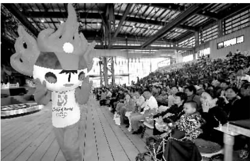
5月8日,在《魅力北京》最后一场演出中,扮演福娃的演员走下舞台与观众依依惜别。

北京馆的展陈设计别具匠心。通过独特的视角,贯穿过去、现在、未来。在前展区,通过设置老胡同、老字号和不同年代老电视机播放60年来的重大事件和具有深远意义的历史瞬间的电视影像墙,展现北京的过去;在核心展区,通过新颖的展陈技术,设置北京奥运会和60年国庆精彩瞬间及全球和国内领先的高科技产品,并通过播放张艺谋导演的《北京的声音》影片,展现魅力首都的风采;在后展区,通过设置未来北京形象墙、景观雕塑等文化元素,彰显北京建设世界