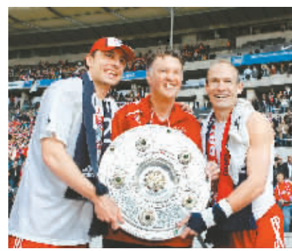
5月9日,在德国足球甲级联赛最后一轮比赛中,拜仁慕尼黑队客场以3:1战胜柏林赫塔队,成为本赛季德甲冠军。这也是拜仁历史上第22次夺得德甲联赛冠军。图为拜仁主帅范加尔(中)与队长范博梅尔(左)、队员罗本庆祝胜利。