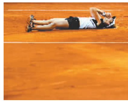
5月9日,在WTA罗马赛单打决赛中,桑切斯以2:0战胜塞尔维亚选手扬科维奇,获得冠军。图为西班牙选手桑切斯在比赛后倒地庆祝胜利。