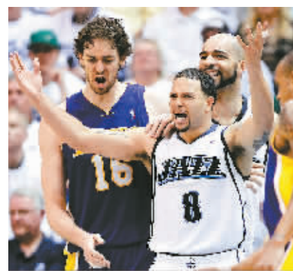
5月9日,在NBA季后赛中,湖人队客场以111:110战胜爵士队,从而以3:0的总比分继续领先。图为爵士队威廉姆斯(中)对裁判判罚表示不满。 新华社发