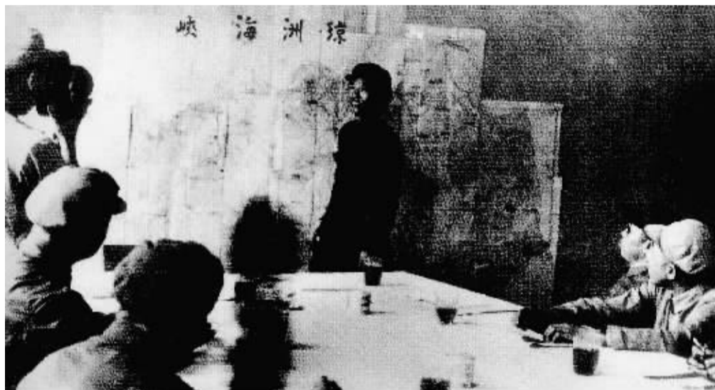
邓华对渡海作战进行战略部署。

30年前的字迹在陈旧的采访本上依然清晰,足以把人带入60年前一段辉煌的革命战争史。