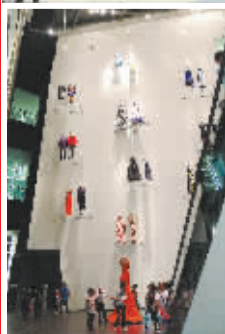
←意大利馆展示的时装。