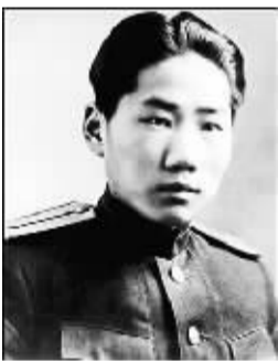
苏联卫国战争打响时,在莫斯科读书的毛岸英坚决要求上战场。