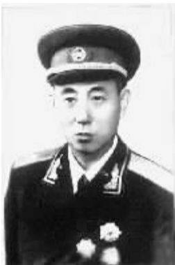
1945年世界反法西斯战争胜利后,王明贵将军获得了斯大林颁发的苏联红旗勋章。

中俄两国人民在反法西斯战争中曾结下深厚的友谊。本期史话版,回顾65年前在苏联卫国战争中做出贡献的中国人。