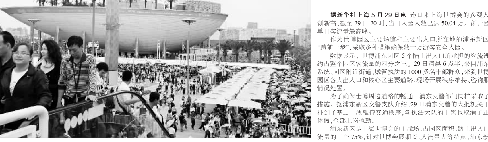
5月29日,游客在世博园亚洲广场参观。

据新华社上海5月29日电 连日来上海世博会的参观人数屡创新高,截至29日20时,当日入园人数已达50.04万。创开园以来单日客流量最高峰。 作为世博园区主要场馆和主要出入口所在地的浦东新区主动“跨前一步”,采取多种措施确保数十万游客安全入园。 数据显示,世博浦东园区5个陆上出入口所承担的客流进出量约占整个园区客流量的四分之一。29日清晨6点半,来自浦东政法系统、园区附近街道、城管执法的1000多名干部群众,来到世博浦东园区各大出入口和核心区主要道路,现场开展秩序维持、咨询服务和情况处置。 为了确保世博周边道路的畅通,浦东交警部门同样采取了特别措施。据浦东新区交警支队介绍,29日浦东交警的大批机关干部都到了基层一线维持交通秩序,各执法大队的干警也取消了正常的休假,全部上岗执勤。 浦东新区是上海世博会的主战场,占园区面积、路上出入口和人流量的三个75%,针对世博会展期长、客流量大等特点,浦东新区要求“跨前一步,主动而为,确保世博后墙不倒。”