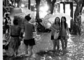
5月28日晚,在南宁市新民路段,市民冒雨走在积水的街头。当晚,广西南宁市遭遇短时强雷雨袭击,城区许多路段严重内涝,对交通造成影响。