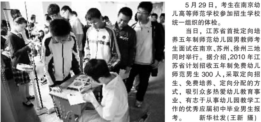
5月29日,考生在南京幼儿高等师范学校参加招生学校统一组织的体检。 当日,江苏省首批定向培养五年制师范类幼儿园男教师考生面试在南京、苏州、徐州三地同时举行。据介绍,2010年江苏省计划招收五年制免费幼儿园男教师考生300人,采取定向招生、免费培养、定向分配的方式,吸引了众多热爱幼儿教育事业的有志于从事幼儿教育工作的优秀应届初中毕业生报考。