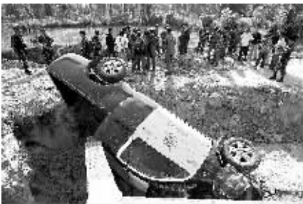
5月29日，泰国警察在南部北大府查遇袭警车。当日，一辆警车在北大府遭遇路边炸弹袭击，造成3名警察和1名平民受伤。