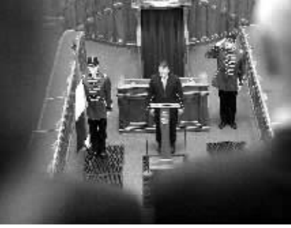
5月29日，匈牙利总理欧尔班·维克托和新政府各部部长宣誓就职，标志着匈牙利新一届政府正式成立。