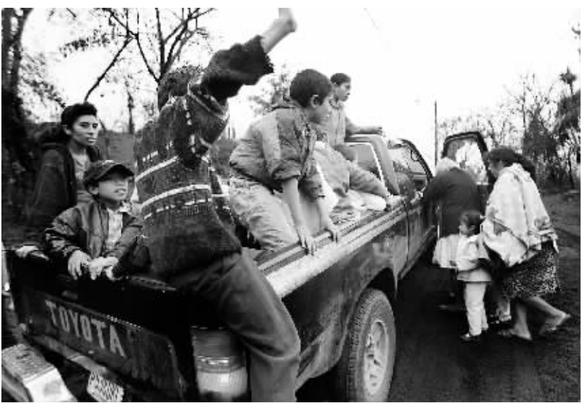
5月28日，危地马拉帕卡亚火山附近的村民撤离村庄。

火山灰覆盖首都 危地马拉城的拉·奥罗拉国际机场发言人克劳迪娅·蒙格说，机场将持续关闭至29日，工作人员正加紧清扫跑道上的火山灰。原计划在拉·奥罗拉机场降落的航班转降危地马拉北部和邻国萨尔瓦多的机场。