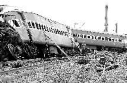
救援人员在事故现场施救。

据新华社孟买5月29日电（记者袁云）据印度媒体29日报道，印度东部西孟加拉邦发生的列车脱轨事故死亡人数已升至131人，另有大约200人受伤。当地警方29日说，经过当天早晨几个小时的搜索，营救人员在损毁的车厢里又发现一些乘客的遗体。目前搜救行动仍在进行，死亡人数可能继续上升。