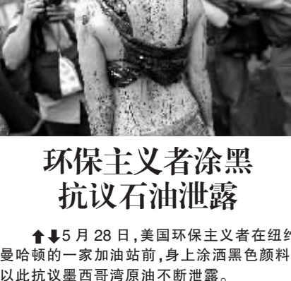
5月28日，美国环保主义者在纽约曼哈顿的一家加油站，身上涂黑油漆，以此抗议墨西哥湾原油不断泄露。