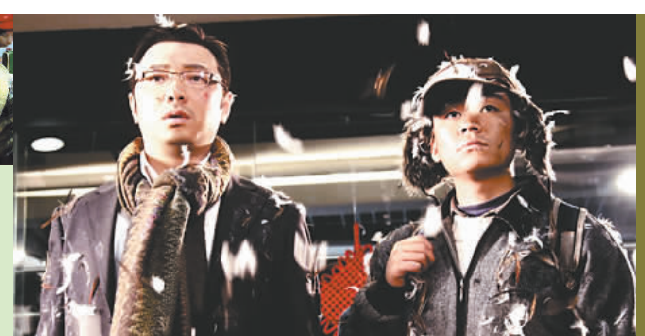
徐峥(左)王宝强领衔主演《人在囧途》

本报讯 即将于6月4日上映的公路喜剧片《人在囧途》28日在北京举行首映礼,除电影主创导演叶伟民、监制文隽,主演徐峥、王宝强、张歆艺等出席外,更有彭浩翔、康洪雷、张国强等业内好友前来助阵。应媒体要求,徐峥和王宝强现场上演了片中十分搞笑的一场“床戏”,徐峥感叹:“我再也不想和王宝强睡在一张床上了。” 《人在囧途》是一部现实主义的喜剧,源自生活中的细节,令影片具有很强的时代感和生活气息。王宝强透露,没想到拍这部戏时遇到了很多和片中一样的趣事:“我跟徐峥老师开拍第一场戏时,因为下大雪在机场等了整整一天,跟电影里的情节很像。就像这个名字一样,我们俩太囧了。” 与很多青年导演合作过喜剧的徐峥表示,他对这部影片非常看好:“我这些年演了不少小成本喜剧片,我觉得关注现实的小成本电影,远比讲述历史传奇