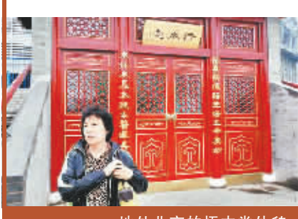
地处北京的悟本堂外貌

本报讯 据重庆时报报道,湖南卫视《百科全说》的热播,掀起了一轮全民养生热潮,“喝绿豆汤、生吃长条茄子可治疑难杂症”、“生吃泥鳅可去虚火”等食疗养生理念大行其道。“厨房就是你家药房”、“隔壁菜市场就是最好的医院”,诸如此类的养生理念,被国内“最贵中医”张悟本推出后,受到全民推崇,食疗养生变得炙手可热。 可惜,这样一档养生节目最近却“霉运”连连。首先,节目嘉宾张悟本的“老巢”,27日被北京工商、卫生等行政主管部门进行突击检查,经检查确认,张悟本的悟本堂医所在相关卫生部门登记注册开办中医诊所,其员工也无医师资质,并非医生。其次,记者28日又从湖南卫视获悉,《百科全说》将从6月7日开始暂别荧屏,取而代之的是《智勇大冲关》。 谁会想到,一档如此火爆的健康节目,竟会以这样的方式收场。