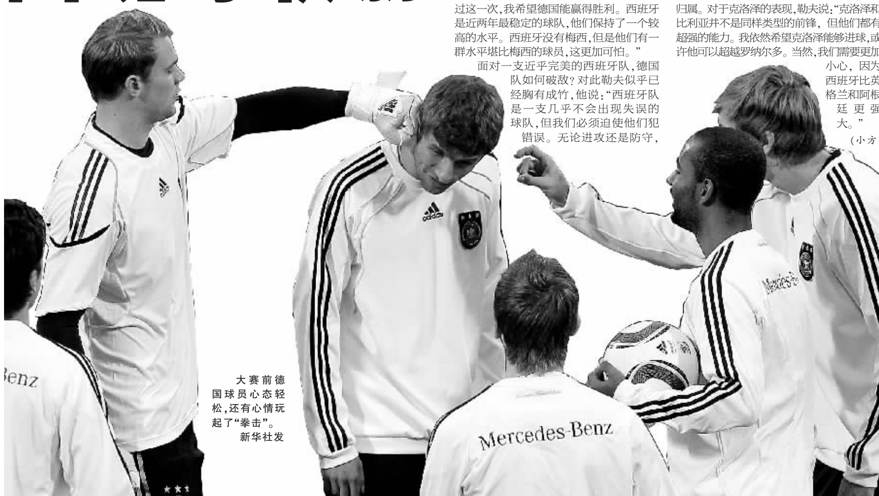
大赛前德国球员心态轻松,还有心情玩起了“拳击”。

本报讯 8日凌晨,德国和西班牙将在世界杯半决赛中狭路相逢。德国主教练勒夫表示,他已经找到了斗牛士军团的软肋,会利用他们的错误一击致命。