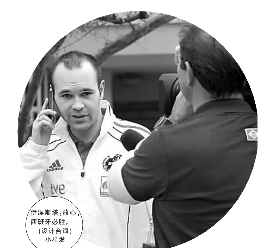
伊涅斯塔:放心,西班牙必胜。 (设计台词) 小星发

保罗的预测结果对德国队而言显然不是什么“好兆头”。不过据德国媒体分析,2008年欧洲杯期间,保罗在决赛前的预测也一直准确无误。但在预测决赛结果时,保罗选择了德国队获胜,而结果是西班牙捧得桂冠。或许这一次保罗又预测错了呢?