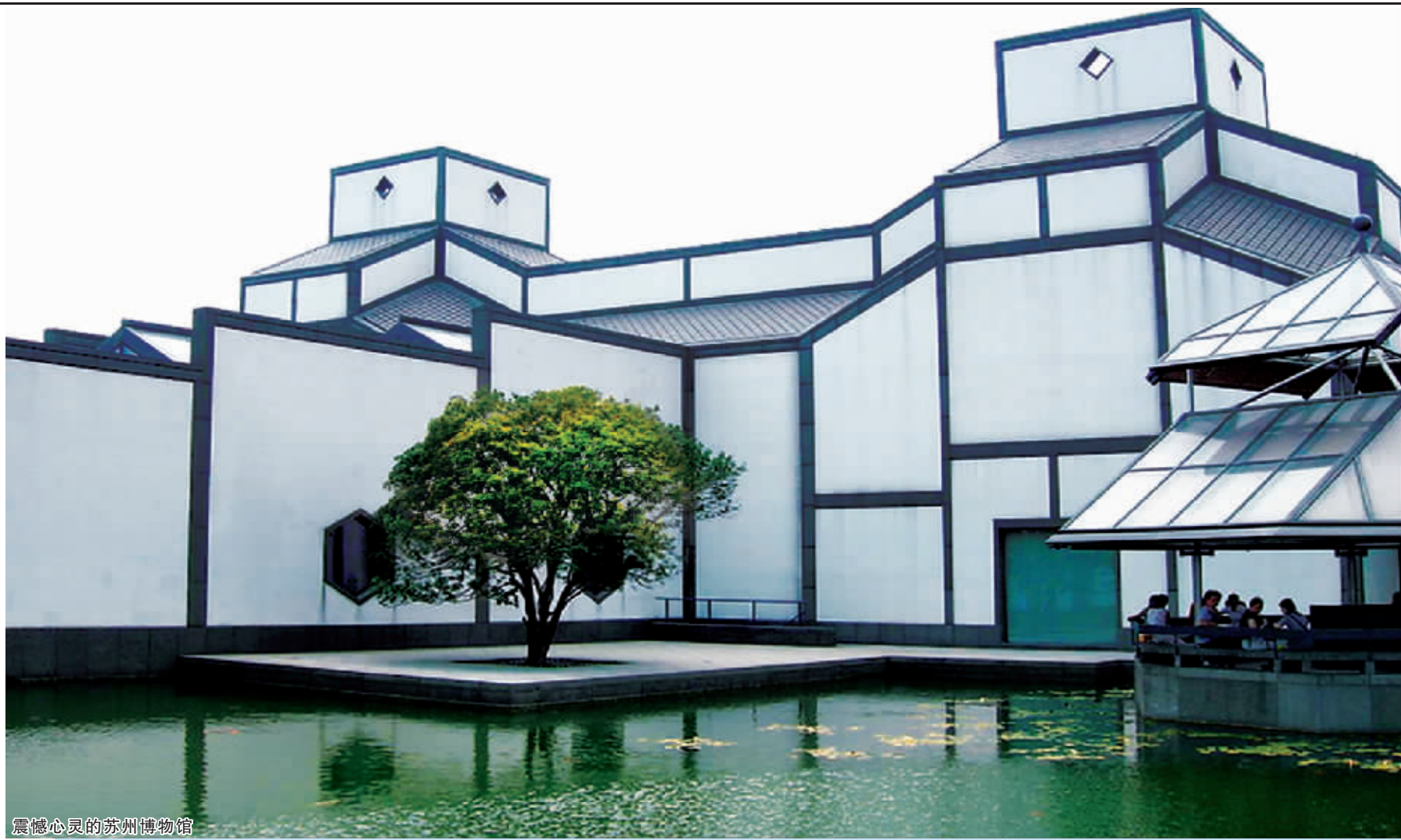
震撼心灵的苏州博物馆