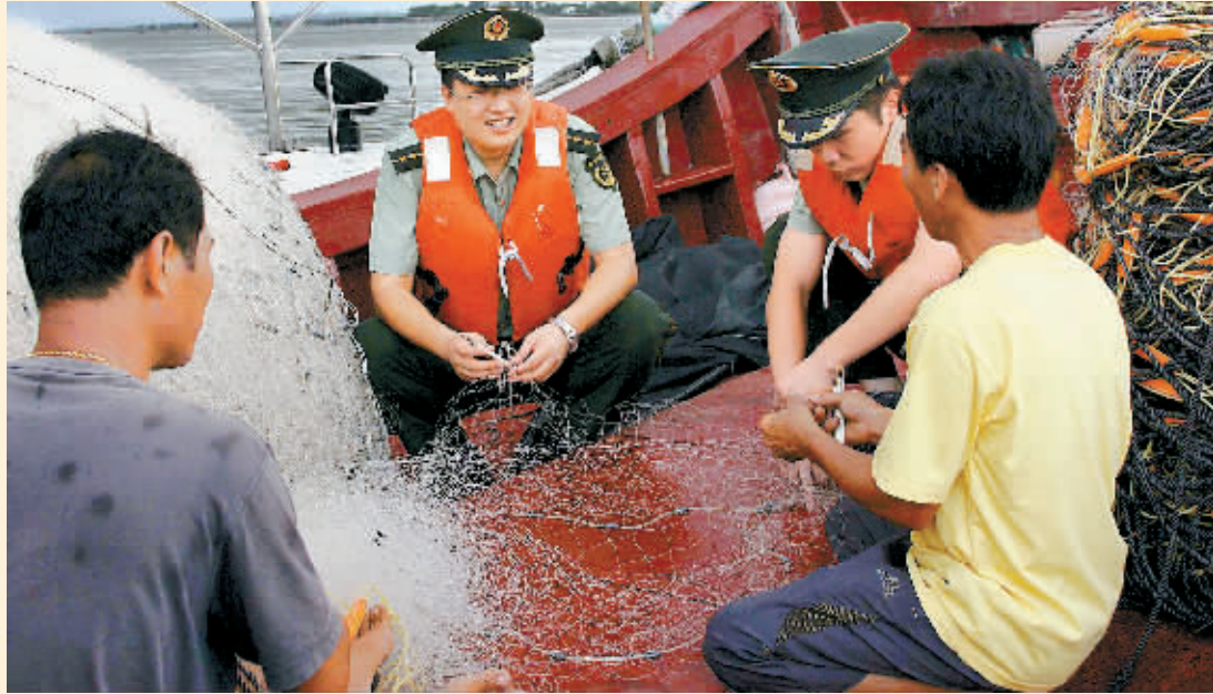
明天南海休渔结束,即将开捕。海南公安边防总队海警一支队加大辖区海域巡逻力度,并组织官兵成立“便民小分队”,为渔民排忧解难,切实维护好南海开渔后的海上生产安全秩序。图为7月29日,文昌铺前港,海警战士向渔民了解开捕准备情况。本报记者 宋国强 文