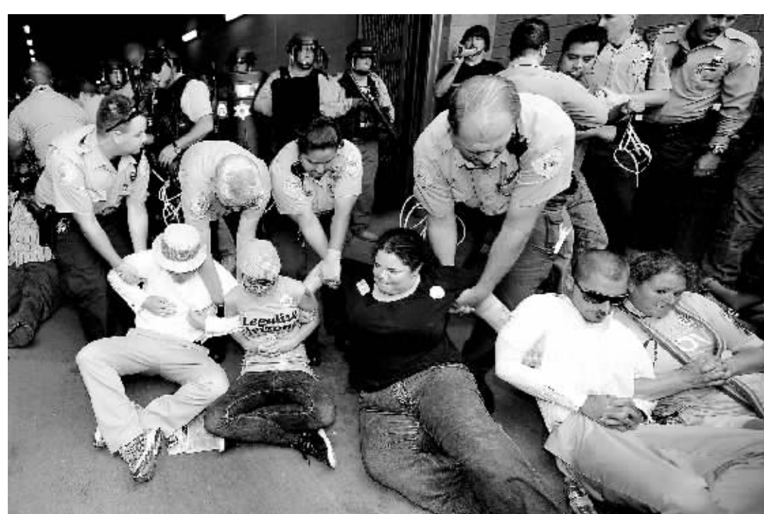
7 月 29 日, 一些示威者在美国亚利桑那州菲尼克斯抗议新移民法时被捕。