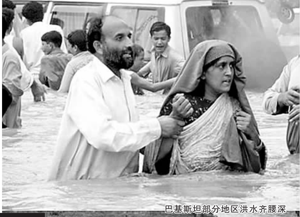
巴基斯坦部分地区洪水齐腰深

新华社伊斯兰堡7月30日电(记者田宝剑)在巴基斯坦西北部被洪水围困的中方水电项目工程人员中,272人30日已基本得到安置,另有3人下落不明。巴方正动用直升机进行搜救。中国在开伯尔-普什图省科西斯坦地区承建的都伯瓦水电项目29日上午遭受洪水袭击,共有275名中方工程人员被困。中国驻巴基斯坦大使馆获悉后,立即启动应急机制展开营救。巴方对此高度重视,根据中方要求立即组织军队、警察和地方政府全力救援。30日,受灾地区天气有所好转,通讯联络逐步恢复,中国驻巴基斯坦大使馆加紧与巴方协调,积极推动救援工作。巴方向中方被困人员提供了紧急救助,并动用直升机加以转移。中国驻巴使馆官员说,截至目前,中方被困人员中已有76人被转移至安全地点,196人得到暂时安置。目前巴方正动用两架直升机搜寻3名失踪中方人员。巴基斯坦全国大部分地区近日连降大雨,导致洪水泛滥。截至30日,洪水已造成400多人死亡。据当地媒体报道,开伯尔-普什图省在巴全国5省中受灾最为严重。