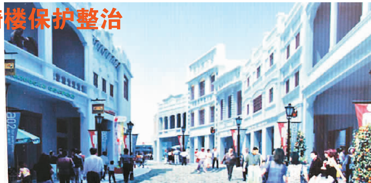
海口水巷口修缮后的效果图。

据介绍,一期工程将对文物和历史建筑进行抢险修缮,完成重要节点及节点建设,对骑楼及老街进行立面修复,实施市政