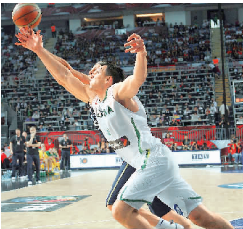
立陶宛队马秋利斯(前)与阿根廷队员争抢。

11日23:00 美国VS立陶宛 12日02:30 塞尔维亚VS土耳其 (CCTV-5直播)