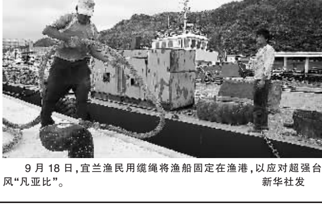
9月18日，宜兰渔民用绳索将渔船固定在渔港，以应对超强台风“凡亚比”。

新华社福州9月18日电（记者涂洪长）“凡亚比”于18日16时加强为超强台风并一路西进。福建省防指分析认为，“凡亚比”在登陆台湾之后进入海峡，并将在闽粤一带沿海二次登陆。为防抗台风来袭，福建省已先期转移6000多海上渔排人员。 据福建省气象部门监测，“凡亚比”18日18时中心位于北纬23.9度，东经124.6度，也就是在台湾花莲偏东方约300公里、福州东南方约580公里的西北太平洋洋面上，中心气压935百帕，中心附近最大风力16级（52米/秒），7级风圈半径220公里，10级风圈半径80公里。预计“凡亚比”将以每小时20公里左右的速度向偏西方向移动，并向台湾东部一带沿海靠近，将于19日早上登陆台湾岛中部；20日凌晨在福建中南部到广东东部一带沿海再次登陆，登陆时仍有台风强度。 受“凡亚比”影响，19日福建省北部沿海将出现阵风9-10级、中南部沿海阵风11-12级；全省沿海地区阵雨转大雨到暴雨，局部大暴雨。 记者从中国气象局获悉，今年第11号台风“凡亚比”具有范围大、路径曲折、强度发展快和强度强这四个特点，或将成为今年以来西北太平洋及南海最强的台风，也有可能成为今年以来登陆我国最强的台风。