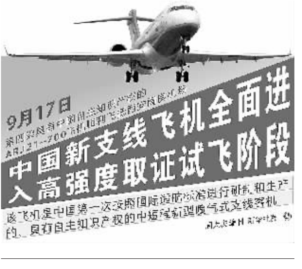
9月17日，中国新支线飞机全面进入高强度取证试飞阶段。这架飞机是中国第一次按照国际适航标准进行研制和生产，具有自主知识产权的中短程窄体喷气支线客机。