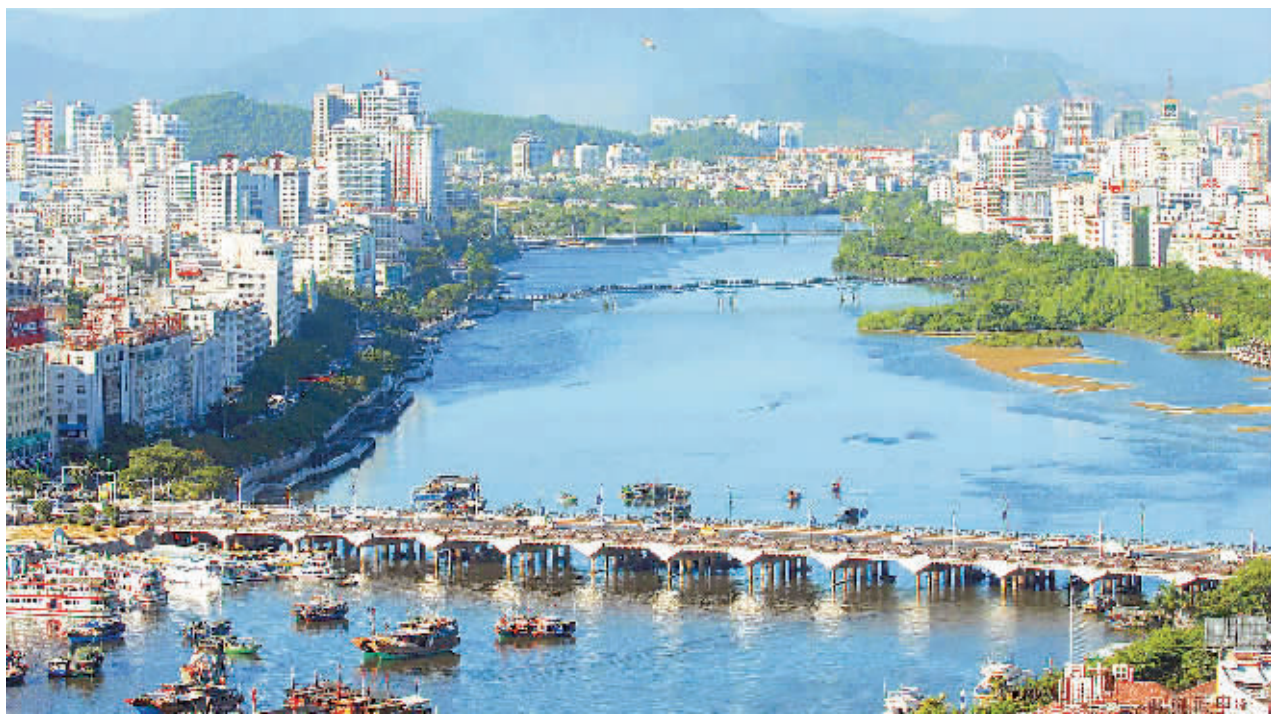
三亚的目标是建成亚洲一流的国际性热带海滨风景旅游城市。图为优美整洁的三亚河两岸。

本报三亚9月20日电(记者刘贡 郭景水)《三亚市城市总体规划(2008-2020)》通过了专家评审。这个新版总规对三亚、对海南全省到底将带来什么?省住建厅总规划师宋祚在解读总规后接受记者采访时表示,三亚新版城市总规具有全省性示范带动作用。 该版规划是在海南省住建厅指导和协