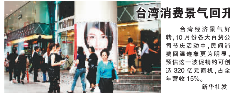
台湾消费景气回升

台湾经济景气好转,10月份各大百货公司节庆活动中,民间消费回温迹象更为明显,预估这一波促销可创造320亿元商机,占全年营收15%。