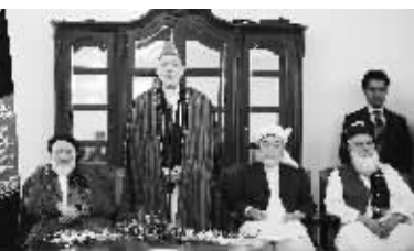
阿富汗总统卡尔扎伊7日宣布阿和平高级委员会正式成立,以推动国家尽快结束战争状态,实现持久和平。