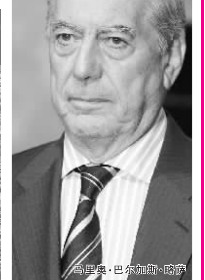
马里奥·巴尔加斯·略萨