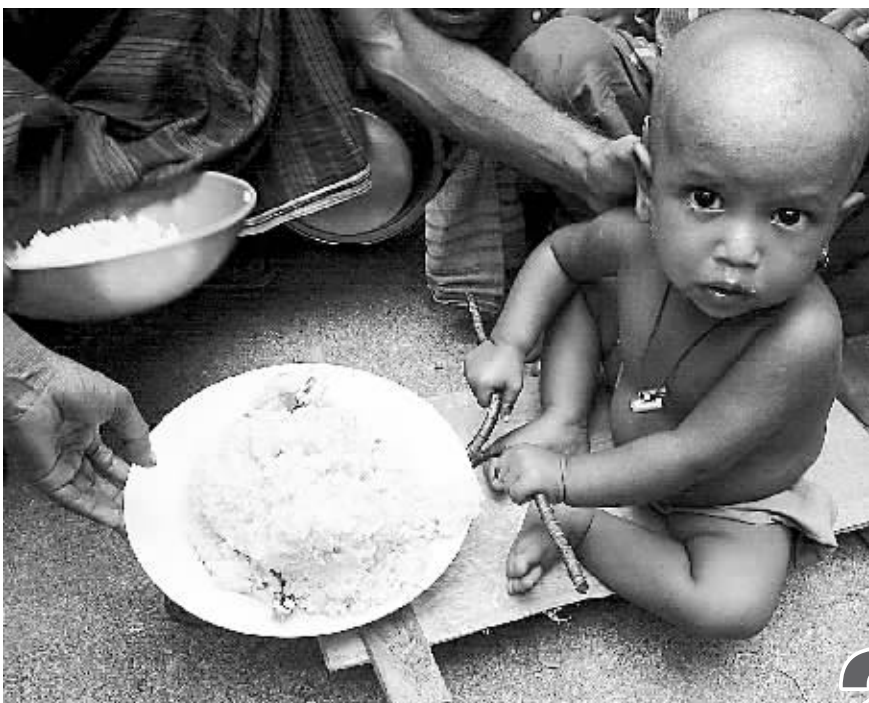
(资料组图)孟加拉洪水灾民艰难度日,在达卡西郊一条公路边,一名小男孩坐在父亲刚刚从一辆赈灾卡车上领来的咖喱米饭前。

温家宝建议,新形势下,中欧领导人会晤作为双方最高级别的政治对话机制,要更好地发挥战略引领作用,统筹中欧各领域、各层次的对话和合作,促进中欧整体关系与中国同欧盟成员国双边关系协调发展,推动解决承认中国市场经济地位和解除对华军售禁令两大难题,为中欧关系进一步发展扫除障碍。温家宝呼吁,世界上所有负责任的国家,都不要打贸易战和货币战。希望欧方在人民币汇率问题上保持客观、公正的立场,并发挥积极作用。