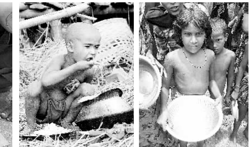
阿富汗、海地、伊拉克、索马里……