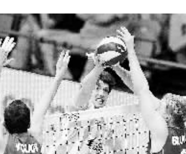
10月6日,在意大利举行的2010年世界男排锦标赛第三阶段小组赛中,阿根廷队以0比3不敌俄罗斯队。