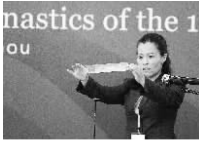
抽签嘉宾为亚运会足球项目抽签。

据新华社广州10月7日电(记者赖雨晨 贾文军)广州亚运会足球抽签仪式7日下午揭晓。在男足项目中,由于抽签过程出现技术差错,F组的队伍在经核对后得以更正;引起关注的东道主中国队与劲敌日本队分在同组,小组头名之争势必激烈。女足分组中,中国队在小组赛的主要对手将是韩国队。