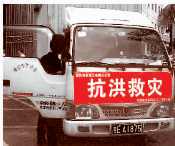
(图为文昌分公司支援救灾抢险救灾车)

与此同时, 10月6日至, 海南电信通过海南自救会等当地自救队伍和网上宣传, 告知广大客户暴雨期间可能出现中断及电信公司正派员抢修的信息, 同时为10000号客服人员到全省营业网点开辟绿色通道, 对通信中断地区进行解释, 安排客户。10月9日至, 海南电信在全省营业网点和部分专营店, 开通免费平安热线423部电话, 供市民免费拨打国内电话给家人报平安, 截止10月18日, 共有57539人次使用免费热线