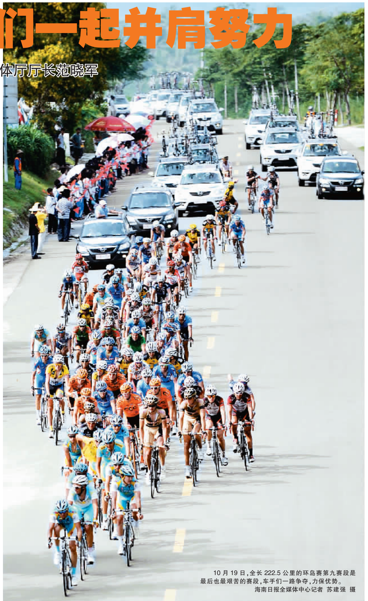
10月19日,全长222.5公里的环岛赛第九赛段是最后也是最艰苦的赛段,车手们一路争夺,力保优势。

请求迅速得到回应,受灾严重的琼海市表示全力支持。副市长梁振认为,这是琼海人的责任,更是琼海人的义务,全力保障赛事顺利进行,各项筹备工作