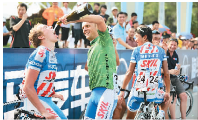
环岛赛结束,车手激情得到释放。图为阿斯塔纳队队友将总冠军伊格林斯基的香槟“抢走”后与队友分享。

赛事整个队伍的吃住。接二连三的暴雨,让赛事路线随时可能调整,如何让这支674人的队伍吃好、住好,就变得异常复杂困难。