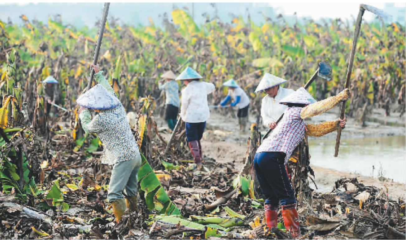
10 月 21 日,琼海市塔洋镇农民清理被洪水浸泡过的香蕉田,准备改种瓜菜。

本报海口 10 月 21 日讯(记者周月光 通讯员陈月花)今天上午,省农业厅召开紧急会议,部署灾后恢复冬季瓜菜生产工作。 下午,省农业厅召开全省灾后冬种瓜菜集中育苗现场会,部署 26 个集中育苗基地统一开展育苗工作。10 月 28 日,还将在文昌、琼海召开全省灾后恢复冬季瓜菜生产现场交流会,总结各县县好的经验和做法,进一步推动灾后冬季瓜菜生产工作。