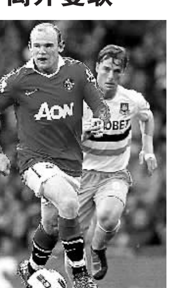
鲁尼(左)带球突破的资料照片。

据新华社伦敦10月20日电 20日,曼联在欧冠联赛中主场1:0战胜切尔西,而就在这场比赛开赛前几小时,一条比这场胜利更具吸引力的消息从曼联传出,当家球星鲁尼正式宣布将不会与俱乐部签订新合同,这意味着他与“红魔”缘分走到了尽头。鲁尼说他离开曼联的原因不是因为与主教练弗格森不和,而是他认为俱乐部在转会市场上缺乏雄心,不舍得花高价引进超级球星。