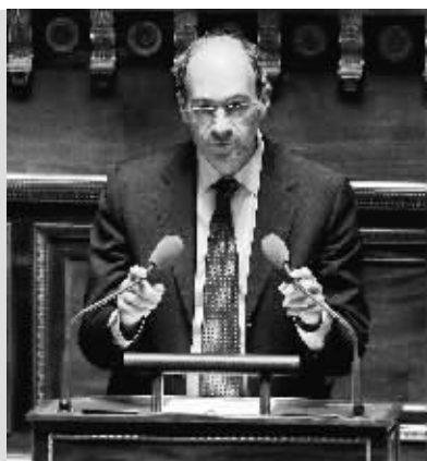
10月22日，法国劳工部长埃里克·韦尔特在巴黎的法国参议院(议会)讲话。

炼油厂和储油库罢工导致法国眼下面临“油荒”，政府22日派出防暴警察前往巴黎附近以及法国西部的几家炼油厂驱散罢工者。总理弗朗索瓦·菲永22日召集石油企业负责人开会讨论燃料短缺问题。他说，石油供应要恢