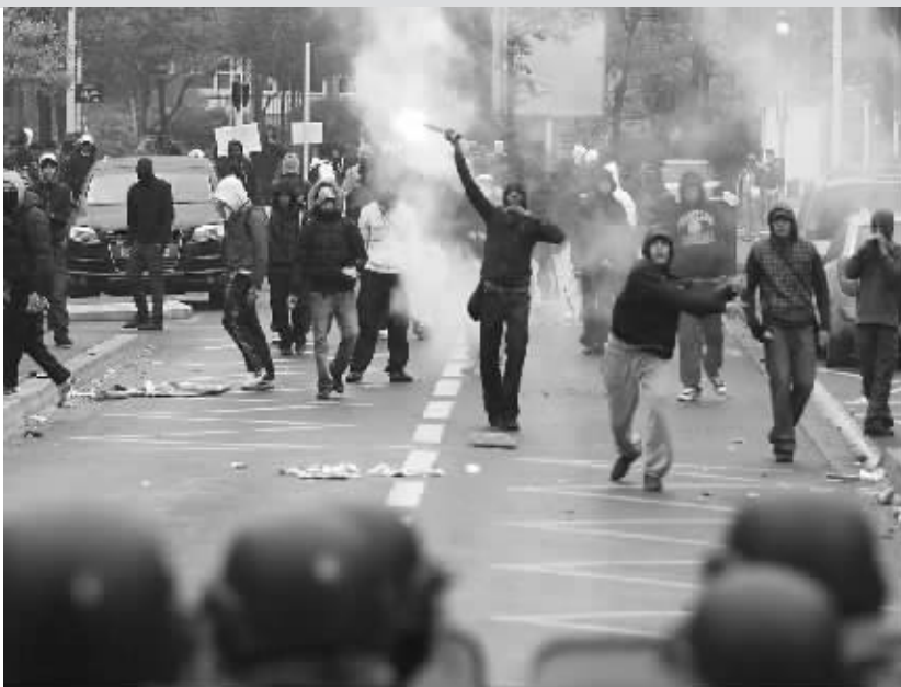
青年人参加近日在法国巴黎举行的反对退休制度改革罢工。

法国工会自本月12日以来组织全国性罢工游行。6个主要工会22日宣布，将于26日和11月6日再次组织全国性罢工，全力阻止退休制度改革法案的施行。工会寄希望于高中生、大学生以及私有