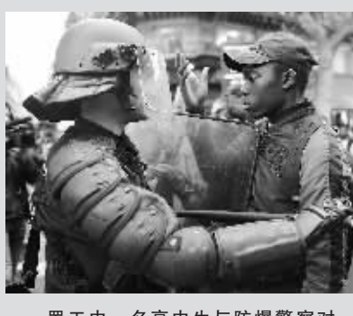
罢工中一名高中生与防爆警察对峙。