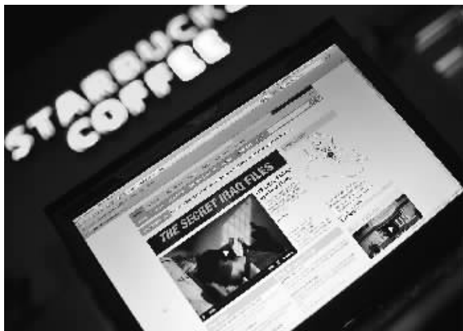
在美国马里兰州银泉市，一家咖啡馆的电脑上显示着阿拉伯半岛电视台网站对揭秘网网站公开美方机密文件的报道页面。